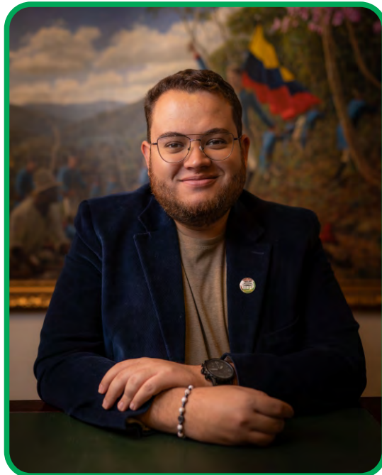
Cristian David Céspedes Correa. Alcalde Municipal de Yarumal