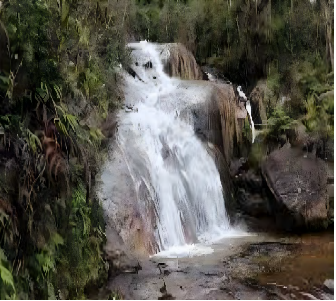
RESERVA SANTA JUANA